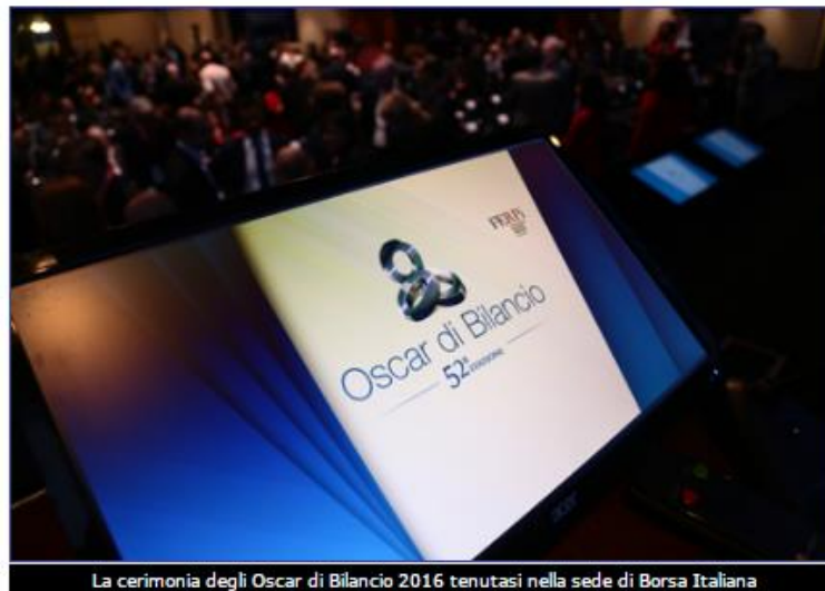
La cerimonia degli Oscar di Bilancio 2016 tenutasi nella sede di Borsa Italiana

Sono stati assegnati ieri, 29 novembre, nella sede di Borsa Italiana e sotto l'Alto patronato del presidente della Repubblica, i 52esimi