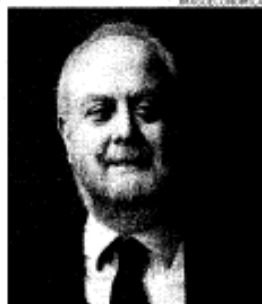
Nella giuria. Umberto Croppi, assessore alla Cultura di Roma