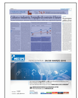
Peso: 1-4%, 29-36%