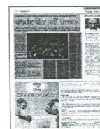
Peso: 1-1%, 13-40%