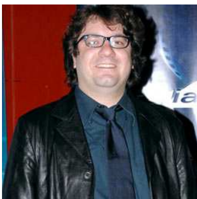
Remo Anzovino

Cinema: "L'intervallo" di Leonardo Di Costanzo. Fotografia: Stefano De Luigi. Giornalismo: Amedeo Ricucci. Letteratura: "Cate, io" di Matteo Cellini. Musica: Remo Anzovino con "9 ottobre 1963 (Suite for Vajont)". Teatro: "La classe" di Nanni Garella. Sono i vincitori del Premio Anima 2013.