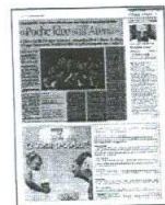
Peso: 1-1%, 13-40%

«È stato un esempio virtuoso di collaborazione del maggior teatro della città con una realtà culturale che emerge direttamente dalla società civile, dalle sue forze migliori, da una stretta unità di intenti